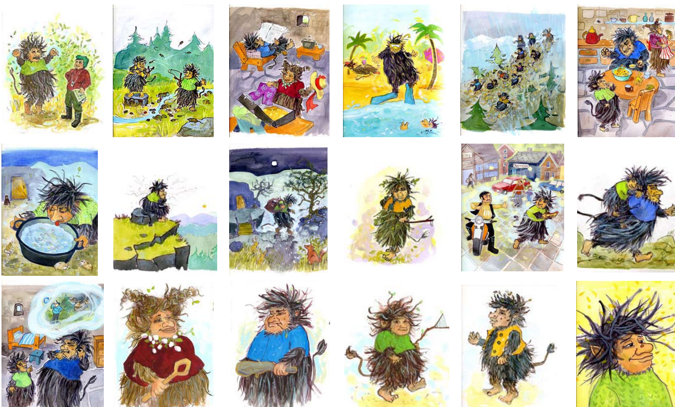
Illustrasjoner: Trine Noodt. © Centrum Norsk Forlag 2009